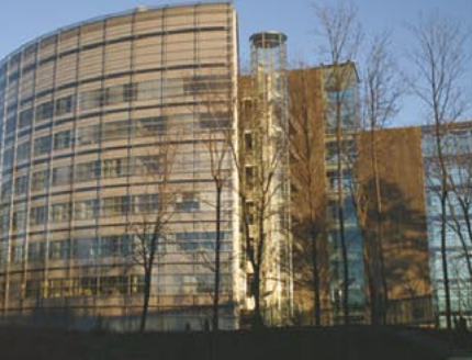
Nokia K2, Espoo