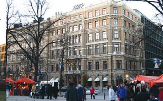
Hotelli Kämp, Helsinki