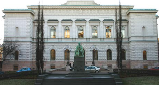
Suomen Pankki, Helsinki